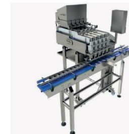
Dosificado 1 Línea