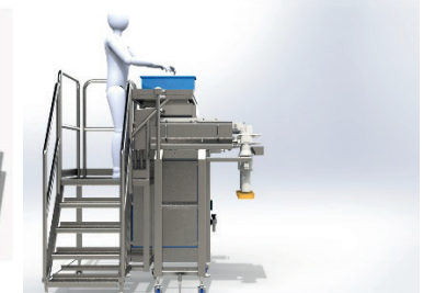
Plataforma de Carga Manual