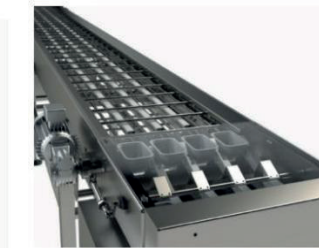
Cinta transportadora envases