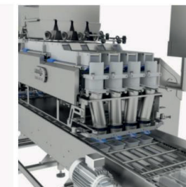
Dosificado 4 Líneas