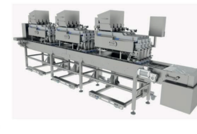
Mezcla 3 Productos